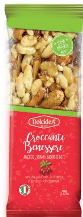
Croccante di Arachidi Sesamo, Bacche di Goji