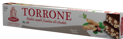
Torrone Morbido Ricoperto Gianduia alle Arachidi