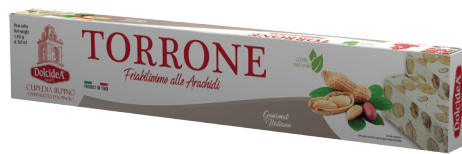
Torrone Friabilissimo alle Arachidi