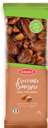
Croccante di Arachidi Sesamo, Mandorle