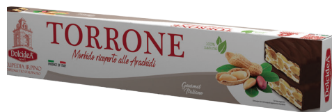
Torrone Morbido Ricoperto alle Arachidi