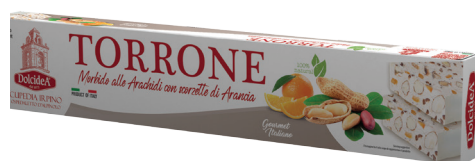
Torrone Morbido alle Arachidi con Scorzette all'Arancia