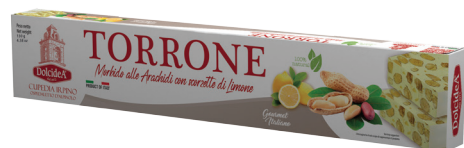
Torrone Morbido alle Arachidi con Scorzette al Limone