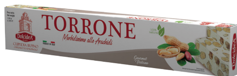
Torrone Morbidissimo alle Arachidi