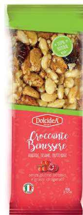
Croccante Di Arachidi Sesamo, Fruti Rossi